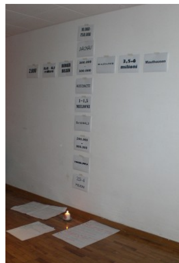
la croce fatta con luoghi e dati della shoà e dalle nostre preghiere

Una delle presenza più ricche e che non sappiamo dove la loro amicizia ci porterà, è quello con la comunità Rom: ormai siamo un luogo di passaggio, di sosta per i più grandi tra di loro che vengono per stare con noi; siamo anche un luogo desiderato dai più piccoli che si affollano attorno alla macchina chiedendoci di portarli con noi per il pomeriggio.