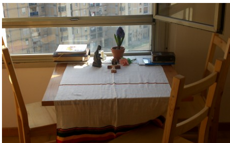
il nostro oratorio provvisorio

Alle 20,00, dopo il momento di verifica quotidiano, i ragazzi tornano a casa e ci fermiamo ancora un po' con i giovani del servizio civile per verificare la giornata e dare gli ultimi ritocchi a quella successiva.