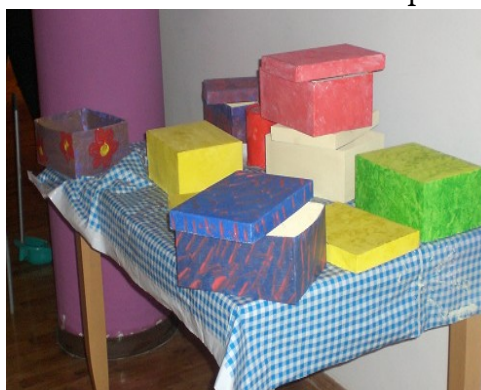
le scatole abbellite con il découpage

altri ci hanno chiesto come aiutarci e stiamo pensando a “micro-progetti” in modo che possiamo far circolare solidarietà ed utopia.